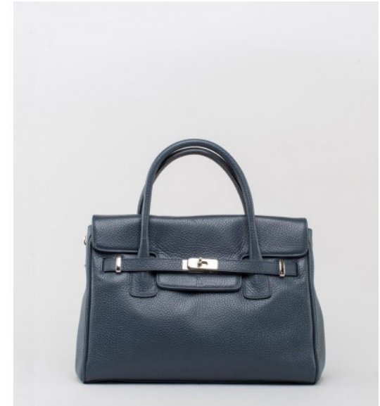
Medium Grip Bag