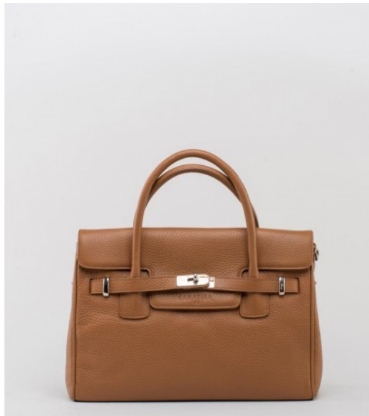
Small Grip Bag