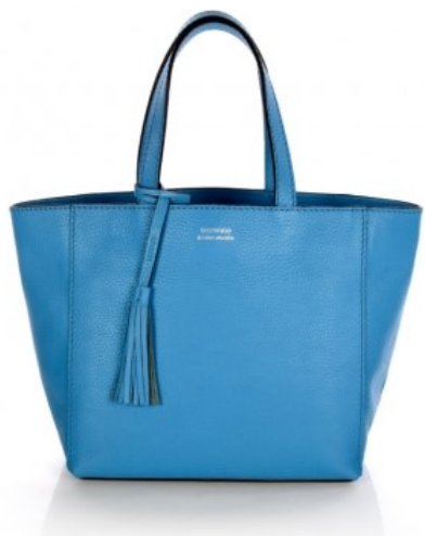
Cabas parisien Cuir